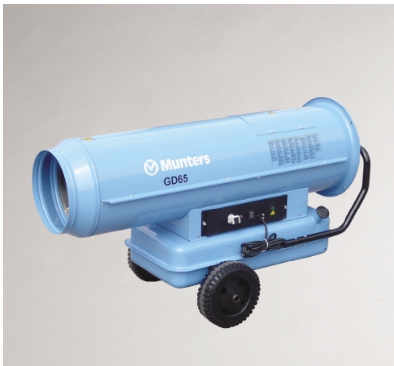
Circulateur GD65 avec équipement complet.

Les générateurs d'air chaud mobiles GD (canons à chaleur) sont conçus pour le chauffage ponctuel dans de bonnes conditions de rentabilité.